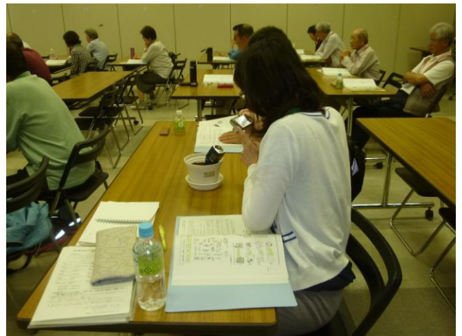
テーマ:「花と緑の基礎知識」 植物について学ぶ