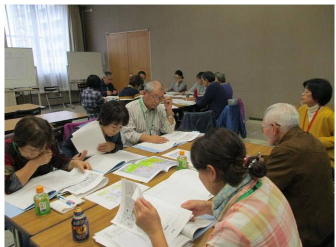
テーマ:「花と緑のまちづくりを学ぶ」 グループ検討