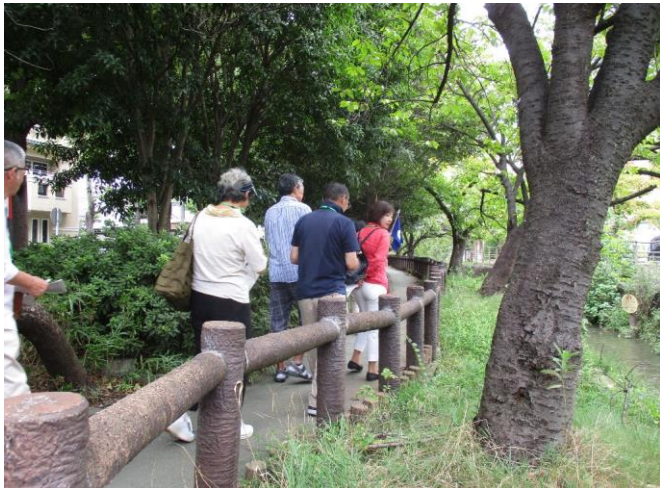
テーマ:「川崎の花と緑を知る」 まちの緑を視察