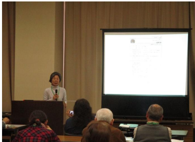
テーマ:「花と緑のまちづくりを提案する」発表