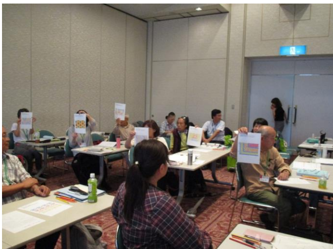
テーマ:「花壇デザインを考える」 デザイン実習