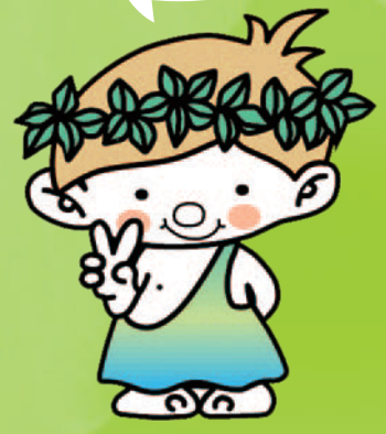
緑の妖精グリーンピー