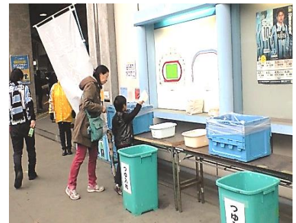
(リユース食器の回収)