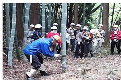
(早野梅ヶ谷特別緑地保全地区)