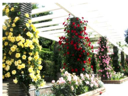
(春のばら苑一般開放)

・ 秋のばら苑開苑期間中における施設警備、来苑者の安全の確保及び各種案内、市民サービスの向上に係わる業務について、ボランティアとの協働により実施した。