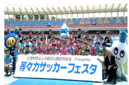
(サッカーフェスタ 2017)