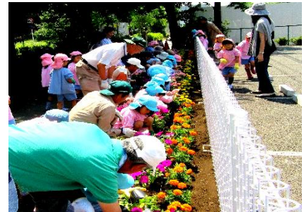
(協会事務所前花壇)