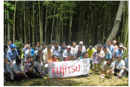
(富士通川崎工場里山コラボ)