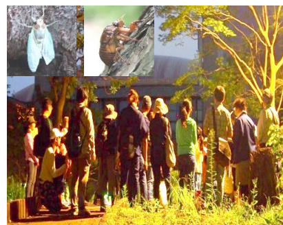
(等々力緑地セミの羽化の観察)