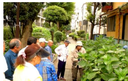
(中丸子南緑道緑を守る会活動支援)