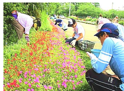
(等々力緑地花がら摘み体験)