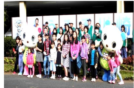
（東名川崎インター周辺）

市内の緑化を効果的に進めるため、市を縦断する3つの軸（道の軸・鉄道の軸・川の軸）を緑化重点の中心とし、その軸線上の吹込交差点周辺、東名川崎インターチェンジ周辺、武蔵中原駅周辺の花壇やプランター及びばら苑アクセスロードのバラの維持管理等を市民や企業との協働により実施した。