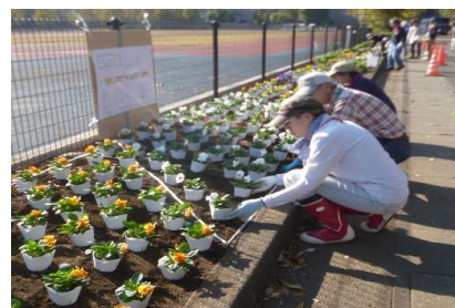
(等々力緑地内花壇での実習)