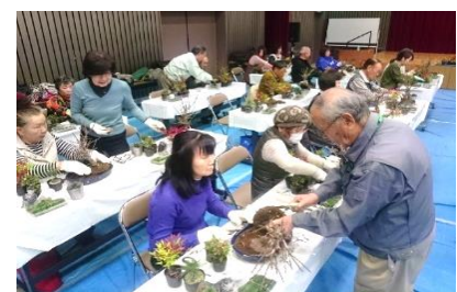
(川崎市総合自治会館)