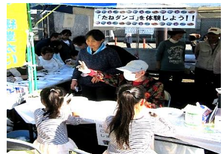
（かわさき市民祭り）