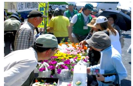
（花と緑の市民フェア）

③第40回かわさき市民祭りに参加し、「たねダンゴ作り体験」を実施し、緑の普及啓発活動を行った。