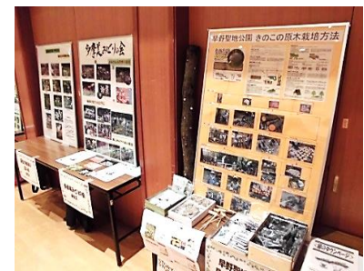
(活動団体パネル展示)