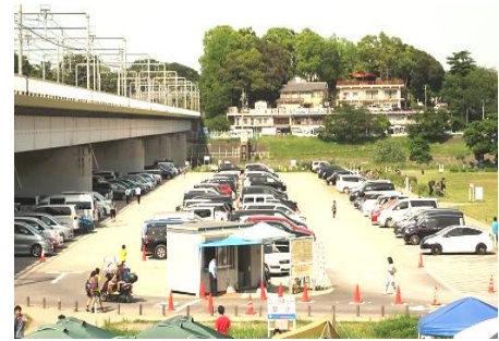
(多摩川緑地丸子橋駐車場)