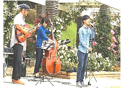
(春のライブコンサート)

緑化の推進と施設の利用促進並びに協会市民還元事業周知を目的に、バラに精通した講師による「ばらの育て方講習会」、来苑者の撮影した「バラの写真展示」、地元中学生や音楽家たちによる「生田緑地ばら苑コンサート」、ボランティアによる「ボランティアガイド」を実施した。