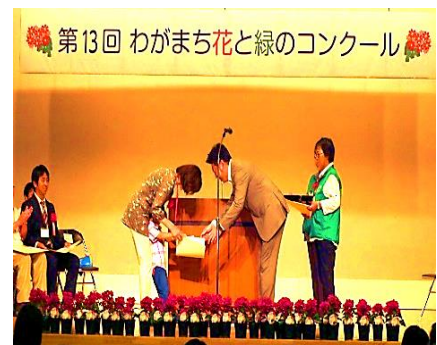
（市長からの表彰状授与・個人部門）