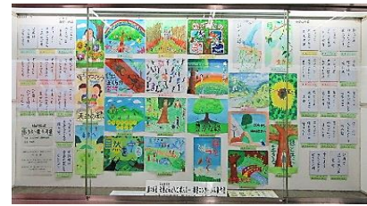
（アゼリア広報コーナー）