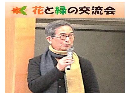
(花壇編・有島薫氏講演)