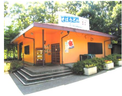
(等々カレストハウス)