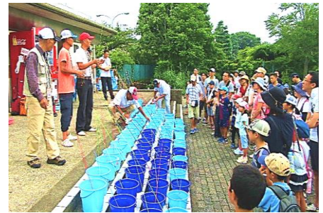
（夏休みこども釣り教室）