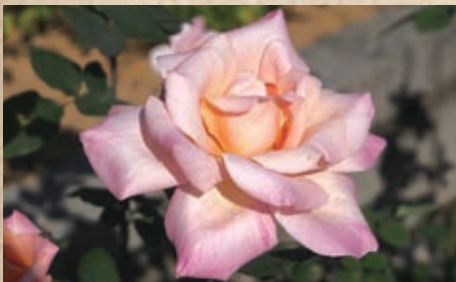
ミッシェル・メイアン

交配親としても多く使われて直系の品種だけでも280種類以上あります。これらピースの子供たちを総称してピースファミリーと呼ばれています。生田緑地ばら苑には代表的なピースファミリーがあります。ご来苑の際はぜひ「ピースとその子供たち」をご覧ください。