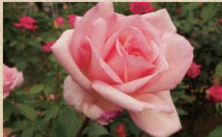
グレース・ドゥ・モナコ

1982 M.メイアン(アンバサダ×ピース) 伝説の美人女優グレースケリー(モナコ大公レーニエ3世妃)へと捧げられたバラです。白地にピンクの覆輪、よく整った上品で美しい花型は名前に恥ないすばらしい品種です。ピース譲りの濃い照り葉が花を一層引き立てます。