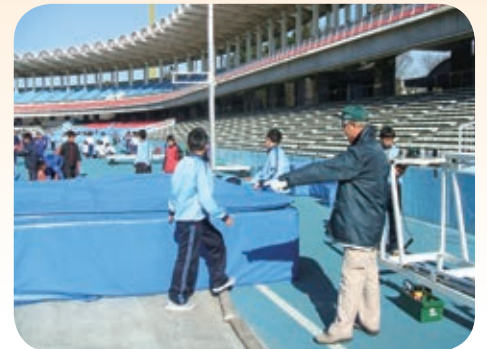
用具の片づけ指導