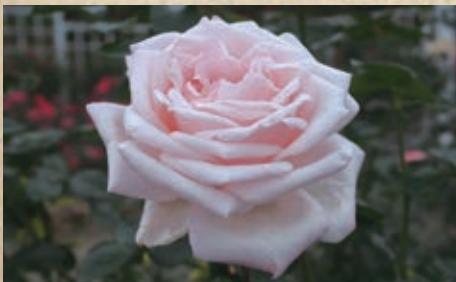
ロイヤル・ハイネス

1959 ハーバートC.スィム(シャロット・アムストロング×ピース) クリーム白にピンクのぼかしが可憐さと豪華さを表しています。ティーの香りがあり、ロイヤル・ハイネスと共にコンテストでも活躍した名花。歴史的な花ピースの直系で、同じく多くに名花の親であるシャロット・アムストロング譲りの強健さもあり花壇用としても十分効果を発揮します。