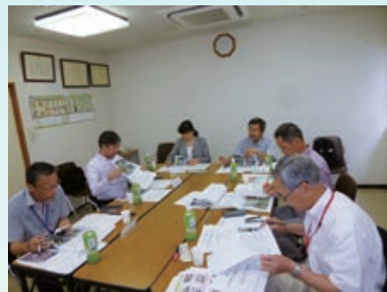
第12回 選考委員会の様子

申込み・問い合わせ (公財)川崎市公園緑地協会 / 電話 044-711-6631