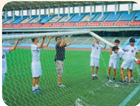
サッカーゴールの設置