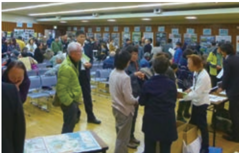
賑やかなパネル展示ブース