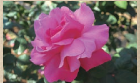
プリマ・バレリーナ

1964 P.J.ハワード(ピース×ザ・ドクター) 濃いローズピンクの大輪品種。名花ピースとザ・ドクターを親に持つ貴重品種。ピース譲りの強健品種で香りもよく、名前のとおり周りを明るく賑やかにしてくれます。