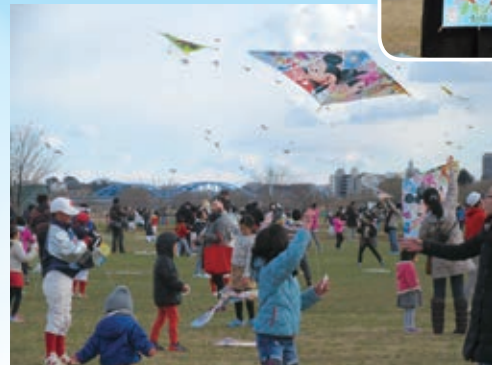
多勢の子どもたちが参加