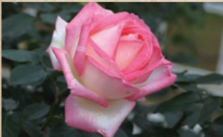
プリンセス・ドゥ・モナコ

1064 A.メイアン(ピース×コンフィデンス) ピースとコンフィデンスという名花同士の交配。花はサーモンピンクで中心は黄色が強くなります。半剣弁高芯咲きで花付きよくピース譲りの照り葉で、ほのかに香りもあります。現在は貴重品種。