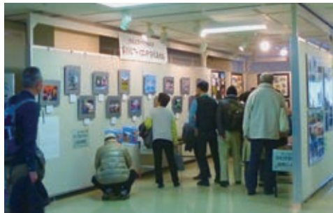
ギャラリー会場(緑の写真展・10年ひと昔展)