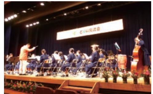
橘中学校の吹奏楽部