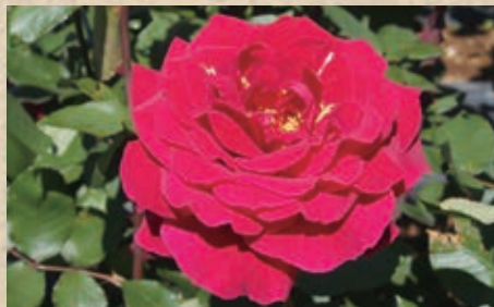
ハッピー・バースデー

1962 スィム&ウィークス(ビルゴ×ピース) 気品のあるソフトピンクの超美麗花。今日に至るまでコンテスト用の名花として親しまれてきたピースファミリーのハイブリッドティです。光沢のある葉やよく整う樹形も美しく非常に優れた完成された品種で、上品なティーの香りも好まれる名花です。