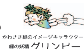
かわさき緑のイメージキャラクター 緑の妖精 グリンピー