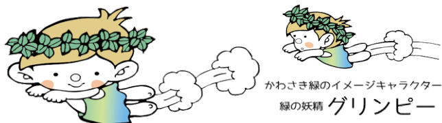
かわさき緑のイメージキャラクター 緑の妖精 グリンピー

●申込み方法：はがきに〒・住所・氏名・年齢・電話番号・メールアドレス・希望日を明記し、公園緑地協会「かわさきの森づくり」係宛、送付ください。実施日の前月1日から実施3日前まで先着順で受付です。現地案内、雨天対応等、詳細は申込者に通知します。