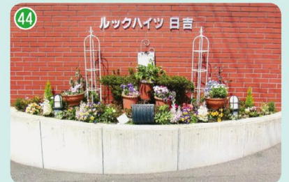
ルックハイツ日吉グリーンクラブ (久末 ルックハイツ日吉名盤の下花壇)