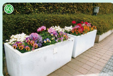
区民ミニ・ガーデン (久末 プラザ橘)