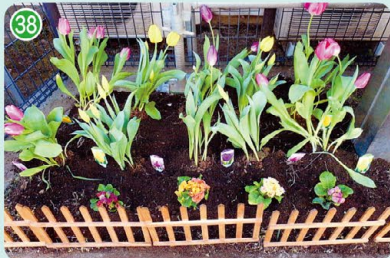
社会福祉法人 川崎市社会福祉事業団 川崎市くさぶえの家 (末長3丁目 川崎市くさぶえの家)