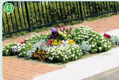
ルックハイツ日吉グリーンクラブ (久末つつじ公園)