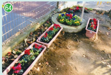
梶ヶ谷花クラブ (梶ヶ谷第三公園)