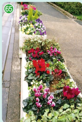
パークシティ溝の口 園芸の会 (久本3丁目 パークシティ溝の口敷地内)