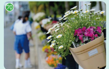
川崎市立東高津中学校 (川崎市立東高津中学校)