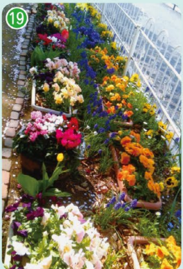
坂戸日商自治会・花と緑の同好会 (坂戸3丁目 坂戸日商岩井マンション・緑の小道)